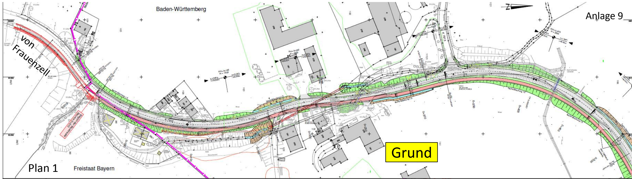
Plan 1 Freistaat Bayern